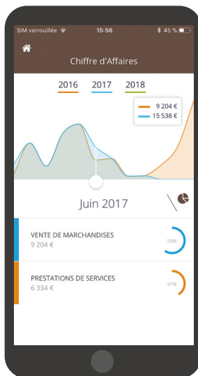
Aperçu en version mobile